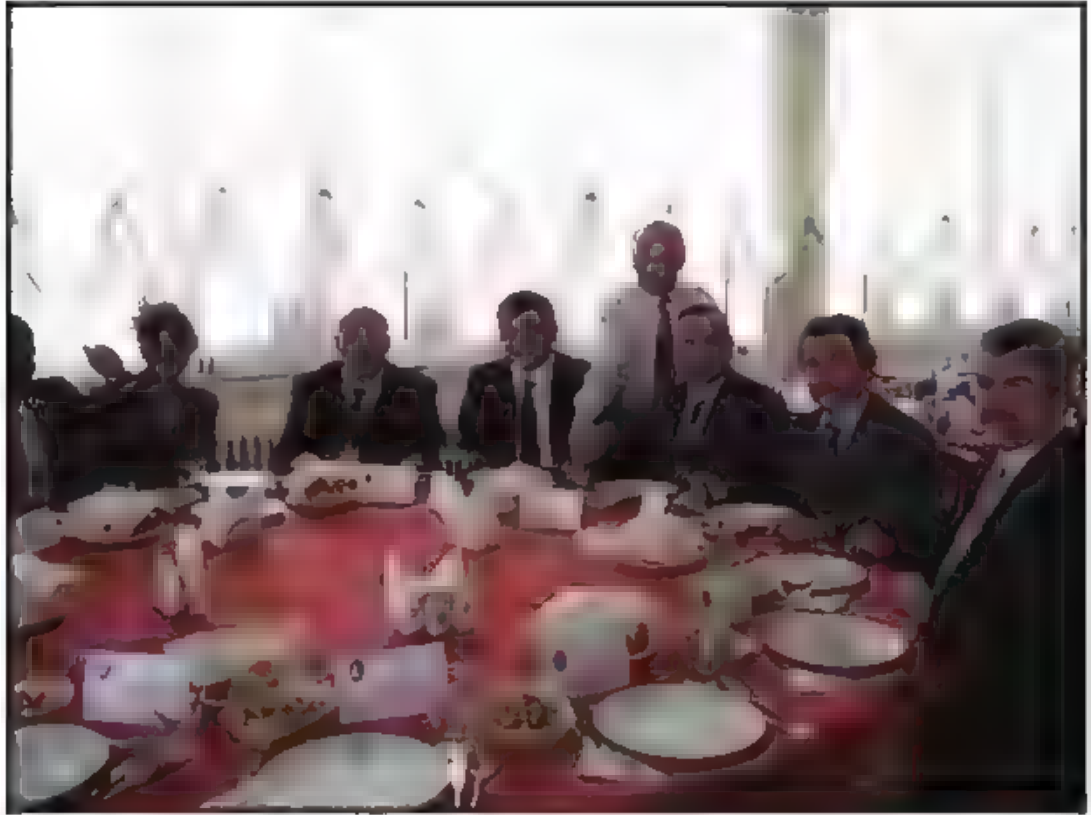
Kars Üniversitesi'nde Öğle Yemeği